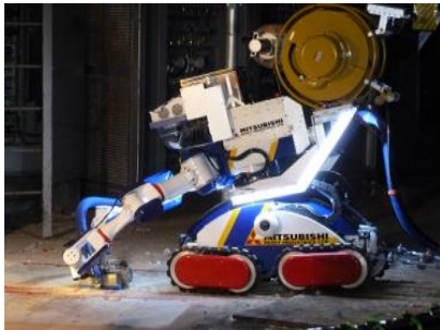
図1 実機除染実証試験実施状況

これらの結果から、吸引・ブラストともに問題なく除染施工が可能であり、開発した除染装置の実機適用性が十分にあることを実証できた。