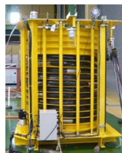
図2 ケーブル・ホース巻取りリール